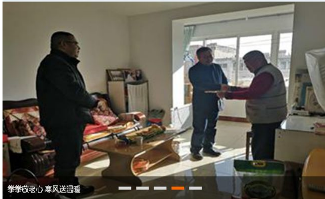
拳拳敬老心 寒风送温暖