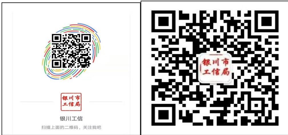
@ 银川工信微博二维码

2018年，银川市工信局网站共发布信息809条，动态类信息491条，市政府门户网站的银川市工信局栏目发布政府信息250条，微博50条，微信18条。