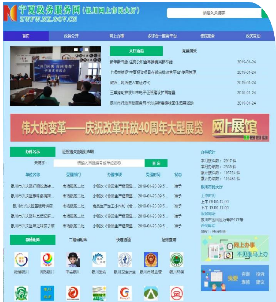
—银川网上市民大厅网站—

提升实体政务大厅服务能力、优化审批办事服务。一是构建“一张网”平台架构。按照自治区政务服务事项“三级四同”和全市政务服务“一网通办”要求，完善宁夏政务服务网·银川旗舰店，实现银川市审批服务管理局办理的500个事项100%网上受理，71类证照100%电子化，“不见面”办理事项达到了82%，并将网络延伸到县（市）区、街道、社区一级，实现