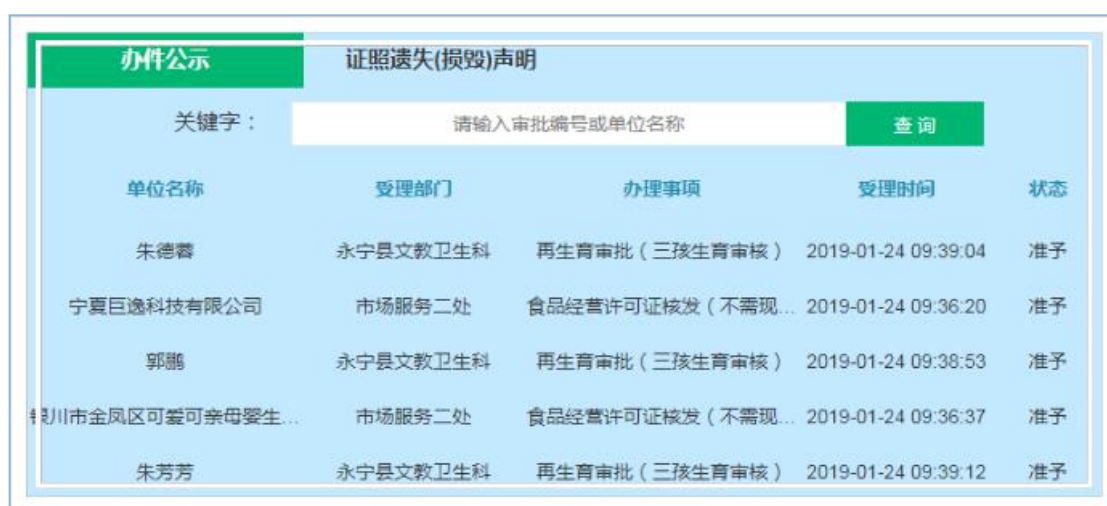
—银川网上市民大厅办件公示栏目—

一是完善“银川市网上市民大厅”网站各项功能。在首页“办件公示”模块中增设查询功能，办事群众可自主快速查询办理事项状态，保障了群众的知情权、监督权。2018年，公示数据16703条，证照遗失（损毁）声明公示3205条。