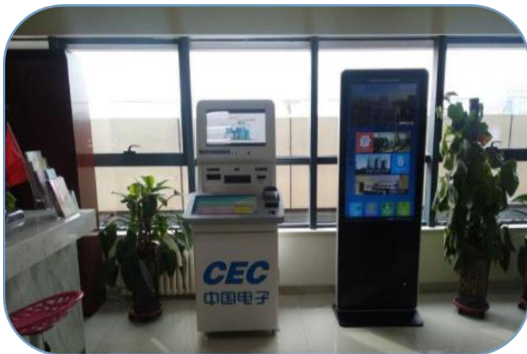
——24小时政务服务自助终端机——

（五）24小时政务服务自助终端全面铺设。 投放38台便民服务终端机，提供24小时“不打烊”服务，有效解决办事群众上班无