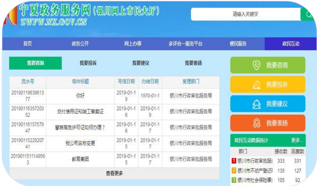
—银川网上市民大厅网站政民互动模块—

银川市审批服务管理局紧紧围绕市委、市政府中心工作，以“关注民生，服务百姓，联系群众”为总要求，积极解