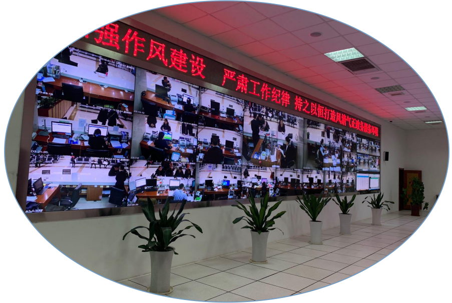
—电子监察室全程督办—

员，做到行政审批信息全部对各监管单位公开，实现审管无缝衔接。以项目投资审批与市场主体准营准入两个方面重新布列事项，贯穿“同步发起”、“即时告知”、“并联办理”、“联合勘验”、“多评合一”等功能和模