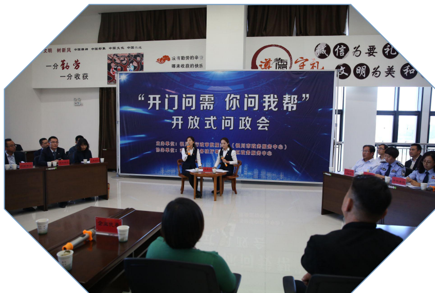
——首创“开门问需”开放式问政会——

（四）找堵点补短板，“面对面”解决群众办事难点。 扎实开展开放日活动，创新形式，首创开放式问政会——“开门问需你问我帮”，邀请人大代表、政协委员、企业代表、办事群众、社区居民等，以办事案例讲述、征询、沟通、座谈等多种方式进行“面对面”现场交流活动，从公众视角查摆政务服务、行政审批改革中存在的问题，已召开4期。