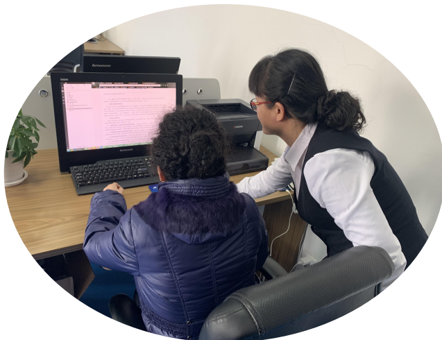
—查阅点工作人员指导申请人查阅政府信息—

（二） 在实体大厅设立咨询引导台、综合咨询窗口和政府信息公开查阅室（点）摆放各级《政府公报》、办事指南等刊物资料；为提高政府信息查询便捷度，银川市民大厅信息公开查阅点收集存储民生类政策文件库，共收集土地类、医保社保类、物价类、教育类、以及其他类文件36个。