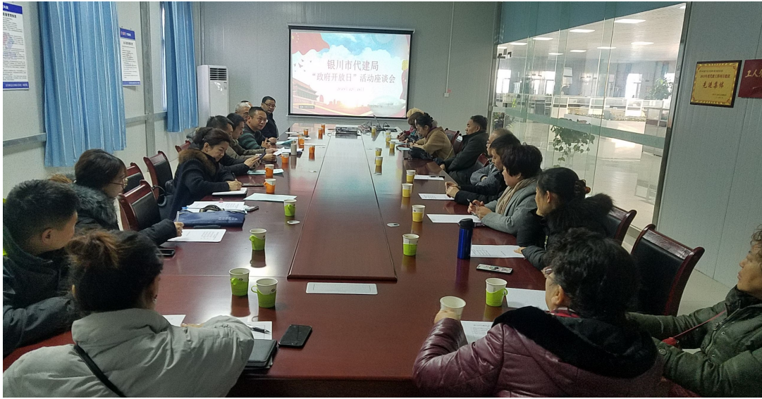
(图三：市代建中心组织开展政府开放日活动)

四是“权责清单”情况： 因事业单位机构改革，市代建中心至今没有专门的组织机构和人员从事代建市场和代建项目的监督管理工作。同时，涉及代建项目工程建设的各类审批备案手续不需经过市代建中心的审核、备案，市代建中心无法及时全面了解和掌握代建项目建设情况，也无法对代建市场和代建项目进行有效监督管理，故至今未开展“对全市代建市场和代建项目的监督检查”相关工作。