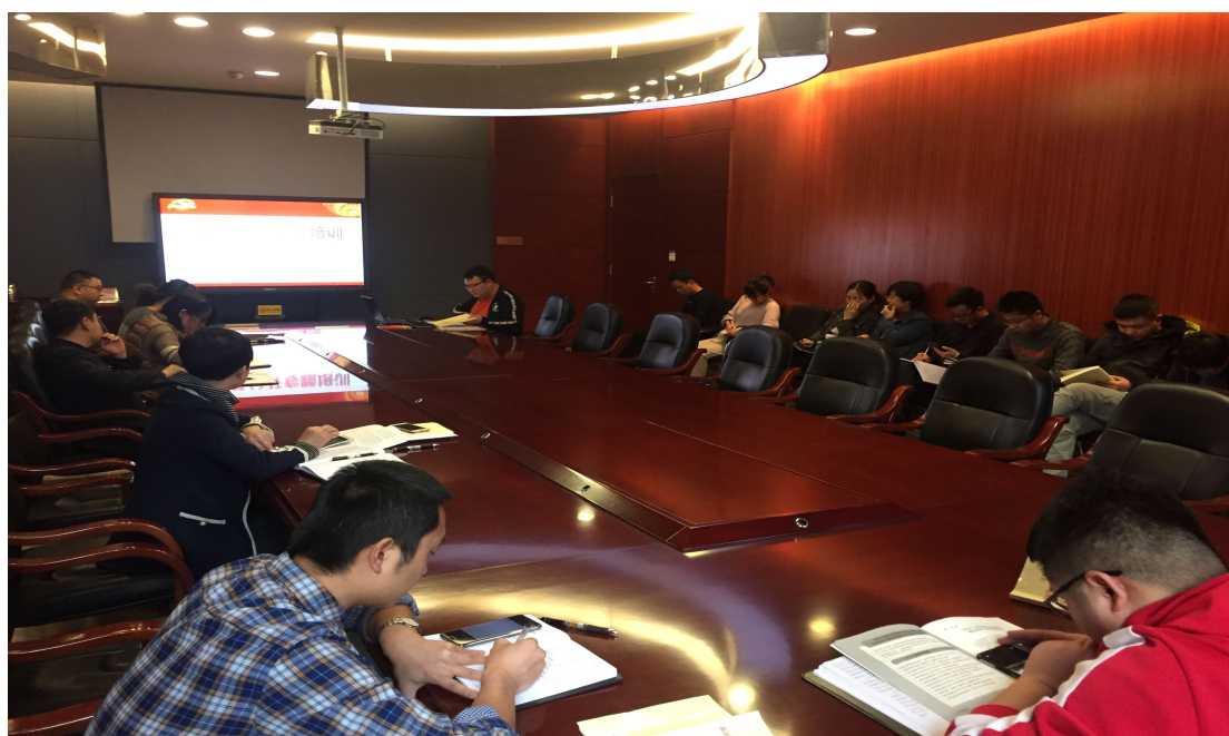
(图八：市代建中心组织全体干部职工进行政务公开工作培训)

复各类重要政务舆情、重大突发事件和民意诉求等。2019年共接到“12345”平台转来市民投诉2件，已办结2件，办结率100%。 三是 切实发挥政务微博的舆情回应作用。市代建中心新浪政务微博2011年7月12日开通，目前拥有粉丝3853人、发布微博530次，2019年共转载、发布政务微博88条，未收到市民投诉或咨询问题。