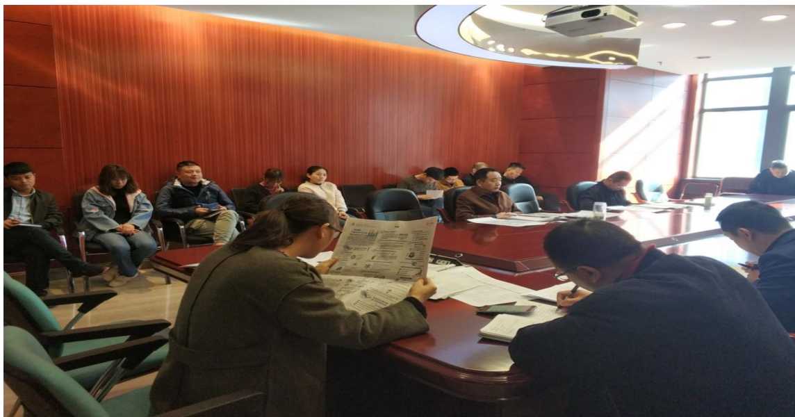
（图七：市代建中心组织全体干部职工学习《条例》）

四是强化培训，提升工作水平。 配齐配强工作人员，抓好教育培训，除定期参加市政府办公室组织的对全市政府各部门、各直属机构网站工作人员、政务微博管理人员的培训外，市代建中心内部还对全体干部职工进行了关于政务公开工作的内部学习、培训，建立起了政务公开工作的长效机制。