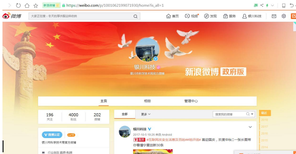
利用银川科技微博开展政务信息公开（截图）