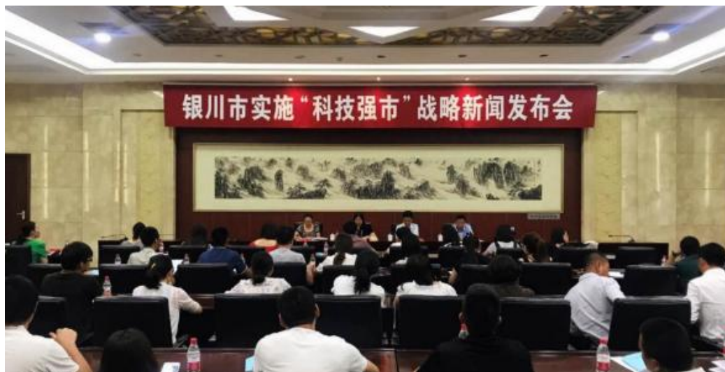
银川市实施“科技强市”战略新闻发布会现场

市”战略实施意见》进行解读。这两次发布会既有宁夏电视台、银川电视台、宁夏日报、银川晚报等传统媒体参与报道，同时又通过新华网、微博等新媒体进行宣传，政策解读宣传力度大、受众面广，达到预期效果。