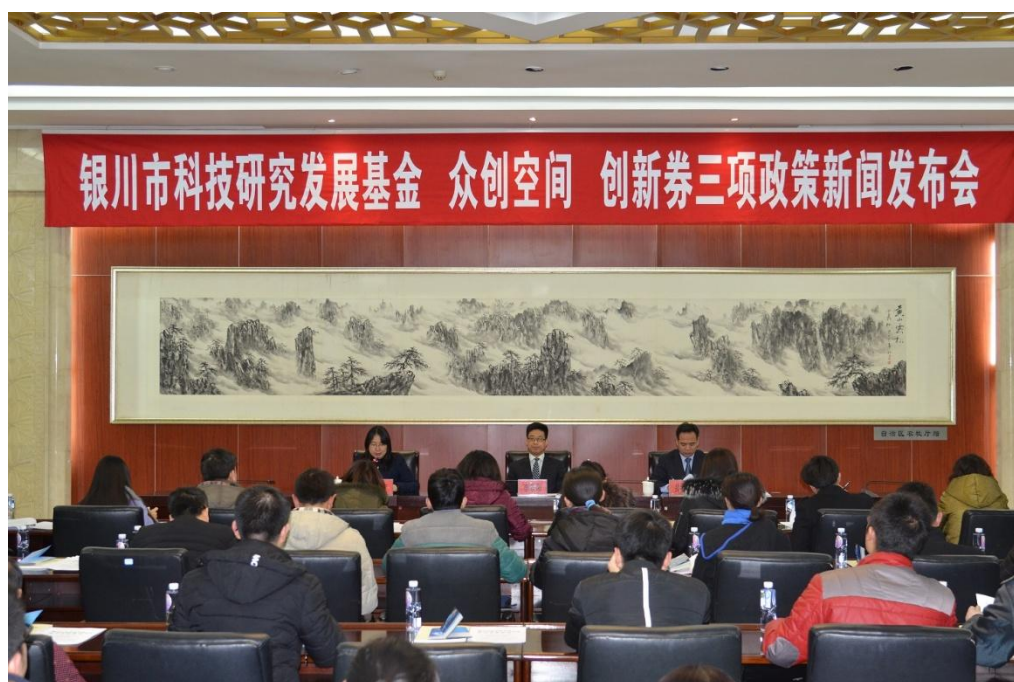
银川市科技发展基金 众创空间 创新券三项政策新闻发布会现场