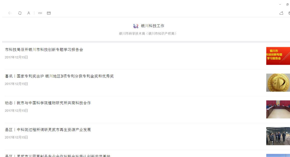
利用银川科技工作微信公众号开展政务信息公开（截图）

2. 做好热点问题新闻发布。银川市科技局于1月19日，会同市财政局召开新闻发布会，发布《银川科技研究与发展基金管理办法（试行）》《银川市众创空间认定管理暂行办法》《银川市科技创新券管理暂行办法》三项政策；8月14日，银川市召开实施“科技强市”战略新闻发布会，并对《银川市“科技强