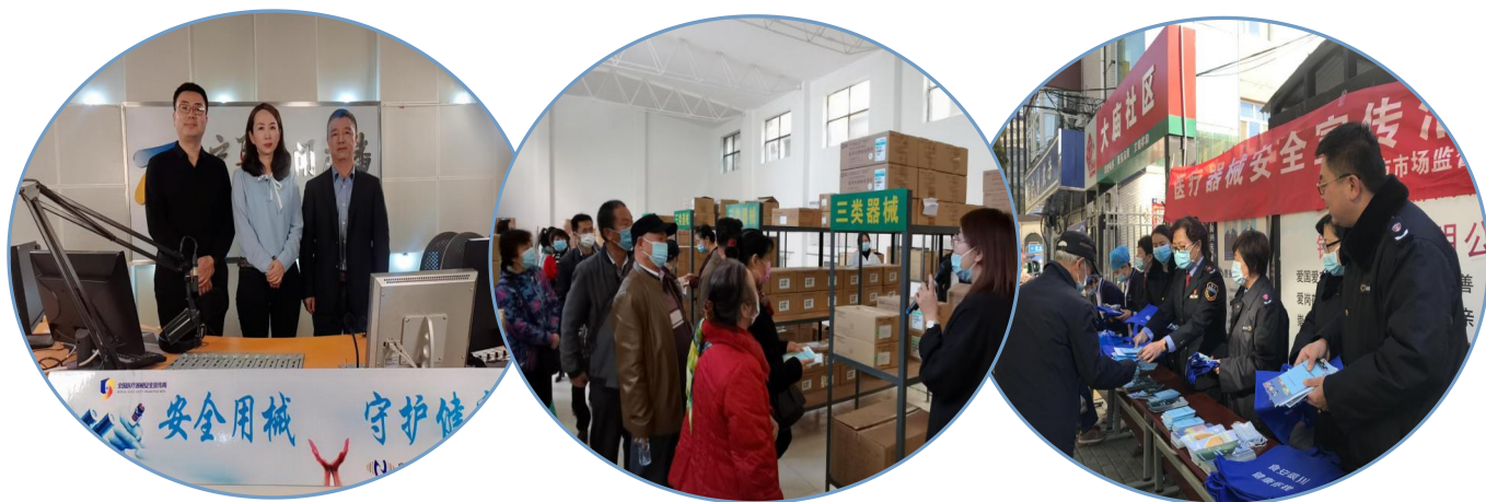
(组织开展“医疗器械政府开放日”活动，主动接受群众监督)

十是回应群众关心关切。2020 年度接收来自“13215”消费投诉热线、“12345 一号通”便民服务平台、银川市政民互动平台等端口的咨询、投诉、举报以及意见建议共 7.52 万件次，均已全部办结。主动公开季度举报投诉情况分析以及春节、五一、国庆等重要节假日诉求分析 13 篇，及时对“AILI 蛋糕异物”“企业未年报将处罚”“侵犯大武口凉皮注册商标专用权”等焦点热点进行回应，有力维护消费者权益，优化消费环境。