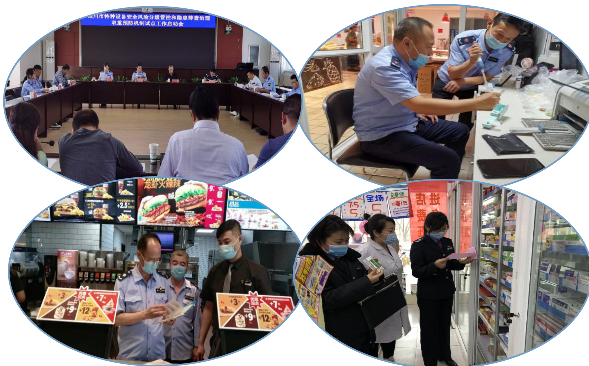
(主动回应关心关切，全力守护“三大安全”)

整治三年行动”加强信息公开，更新食品、药品以及特种设备领域专项整治动态信息 23 条。