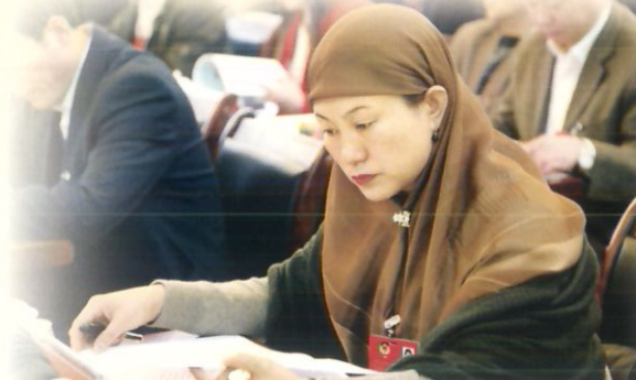
委员们认真聆听会议