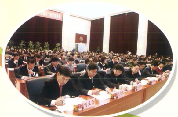
人大代表认真听取《政府工作报告》