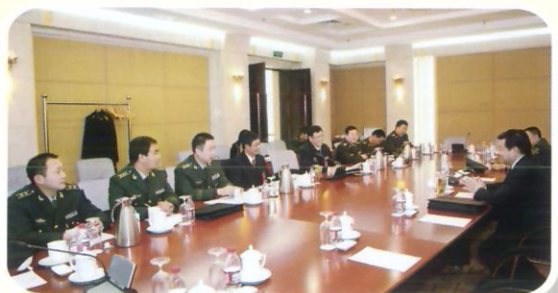
解放军代表团讨论《政府工作报告》