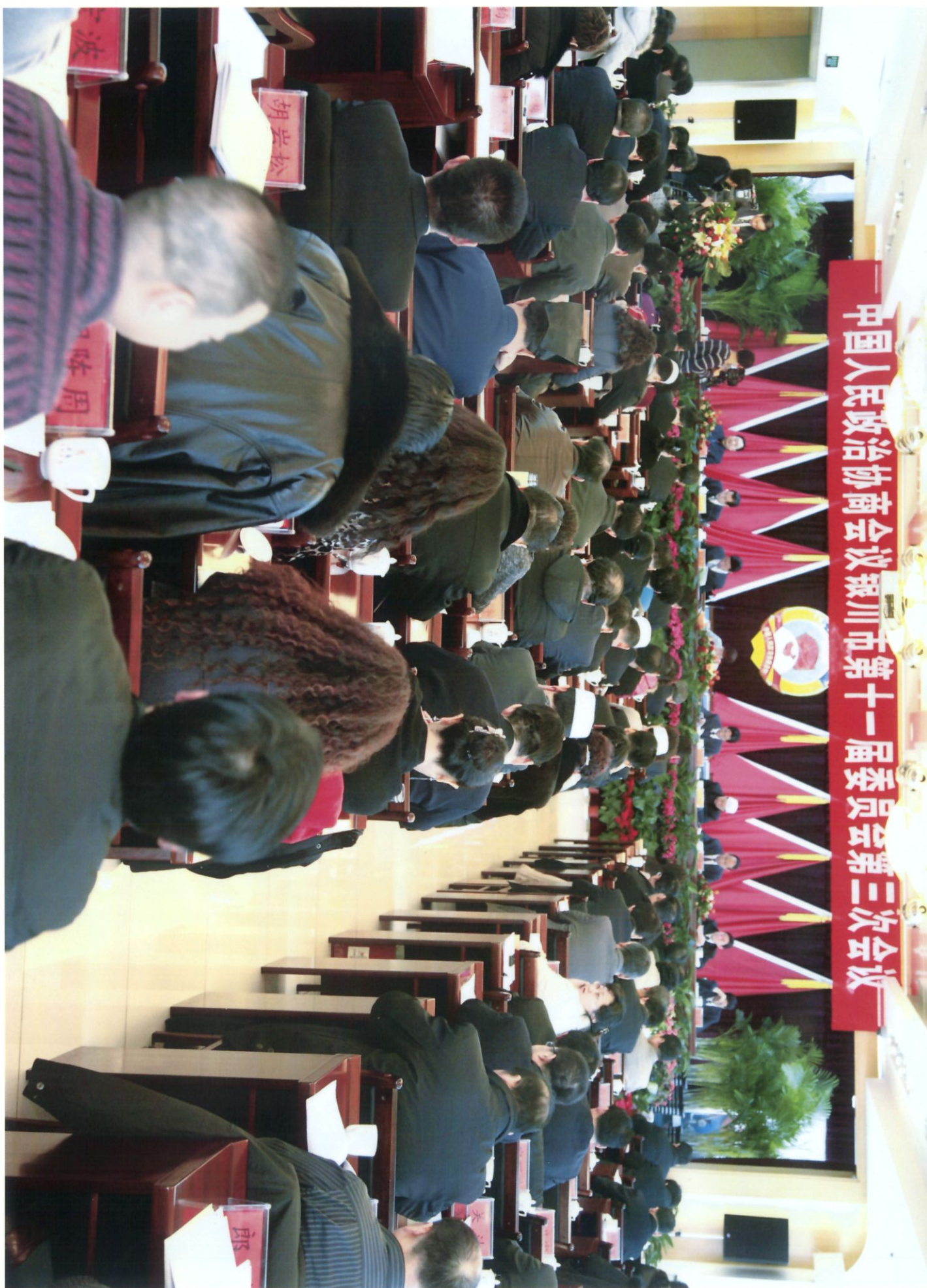
政协银川市第十一届委员会第三次会议隆重开幕