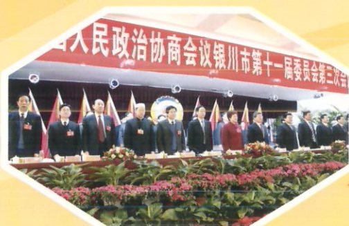
大会在雄壮的国歌声中开幕