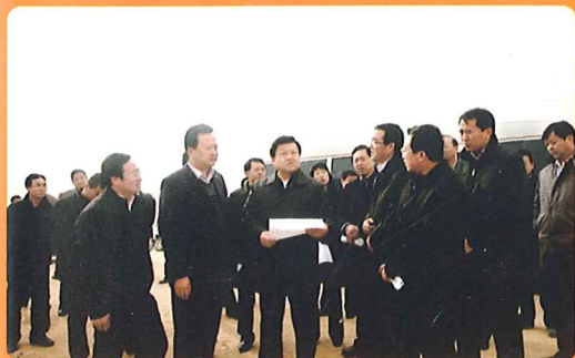
在月牙湖万亩养殖建设基地调研