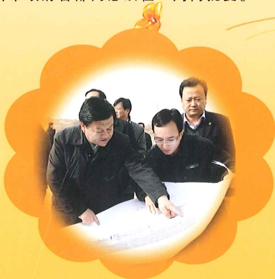
在月牙湖移民安置点调研