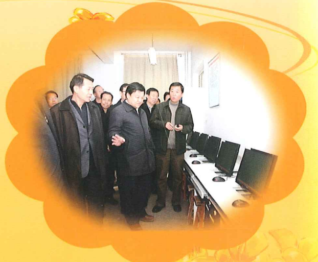
在大连万达集团捐资助学点调研