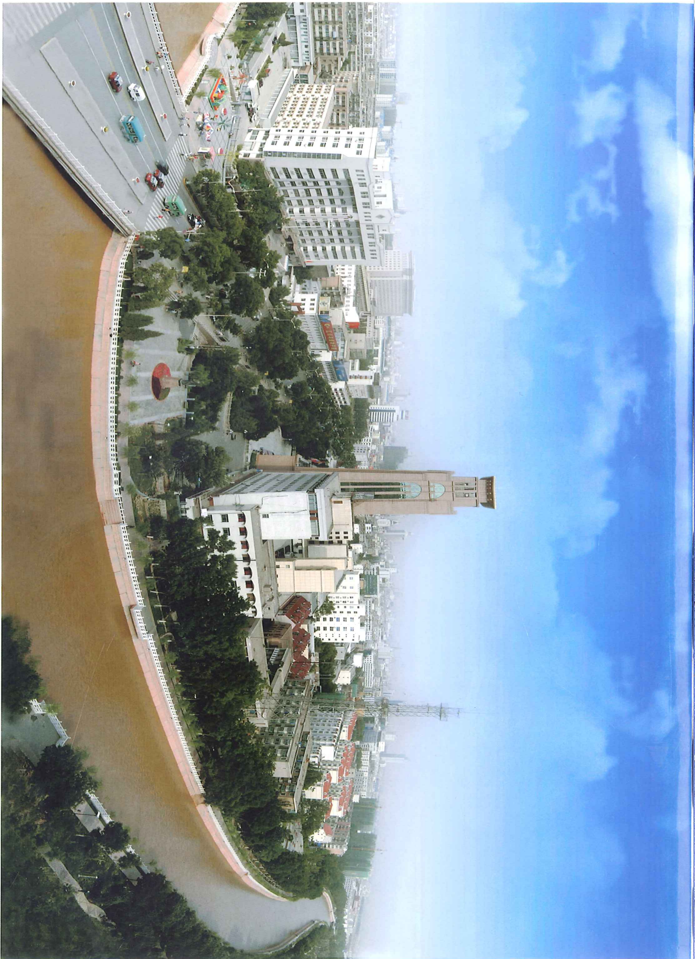
唐徕渠远眺 (资料图片)