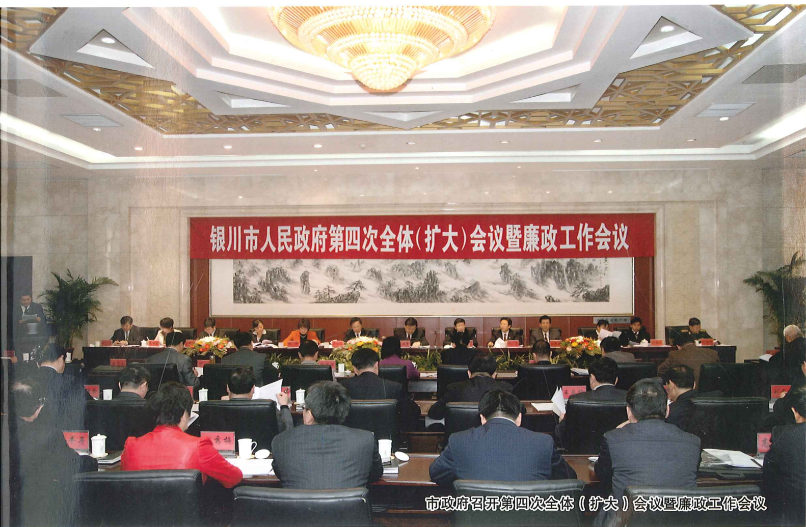
市政府召开第四次全体(扩大)会议暨廉政工作会议