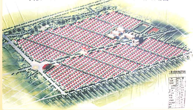
兴庆区月牙湖生态移民安置区一期总体规划图

在调研中，王儒贵强调，涉及到月牙湖移民工程的，政府的所有收费全免，企业所有收费减半，各部门要特事特办，月牙湖移民工程所有报批项目市政府各部门必须在一周内批复。