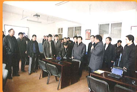
在大连万达集团捐资助学点调研