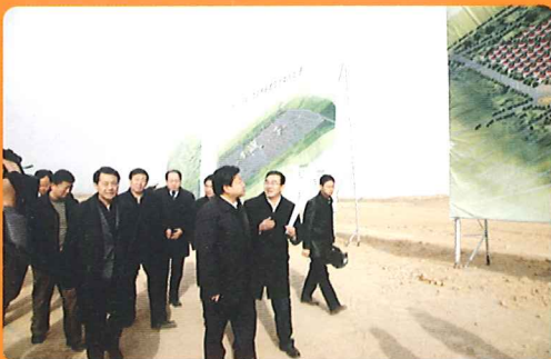
在月牙湖移民安置点调研